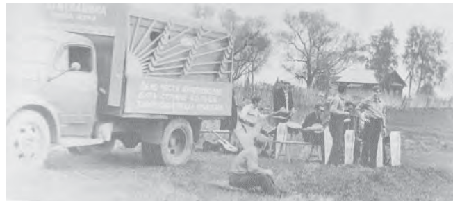
1971 год. Колхоз имени Калинина, село Никола-Пенья. Выступление агитколлектива из Ярославля.