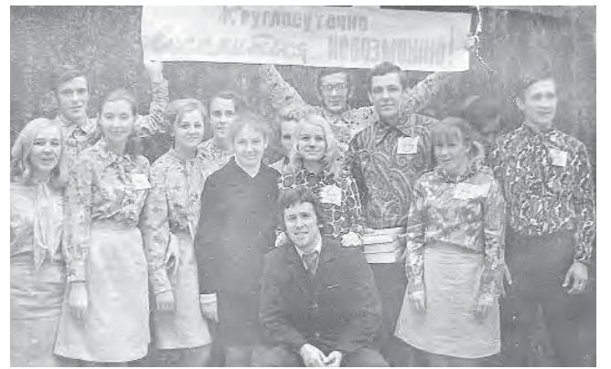
Команда КВН 1972 г. Молодежь с льнокомбината. Прислала Елена Молчанова.

Воспоминания о былом. Что-то в них есть согревающее, притягательное. Потому-то многие из нас с удовольствием просматривают старые фотоальбомы. На них мы – совсем другие, нежели сейчас, да и жизнь вокруг – тоже другая. Тут мы – октябрята, здесь – пионеры или комсомольцы. Горожане шефствуют над селянами, помогая с уборкой урожая, поддерживают «боевой дух» выездными агитбригадами. На льнокомбинате кипит работа, которую, кажется, ничто не может остановить, в клубе «Текстильщик» поет большой хор, а в парке танцуют влюбленные парочки.